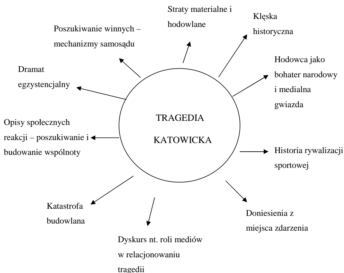
Rys. 3. Reakcja mediów na katastrofę katowicką z 28 stycznia 2006 r.

dzień stał się dzięki mediom bohaterem narodowym. Zdaniem A. Szostkiewicza (7/2006) „katastrofa jako temat przekazu zaczyna żyć własnym medialnym życiem. Staje się przedmiotem obróbki służącej różnym celom i interesom a nie tylko informacji. Mimo najlepszych intencji media ulegają tu pokusie, by z tragedii zrobić reality show . [...] W telewizyjnym reality show sprzedają się emocje. [...] To już nie spłaszczanie egzystencjalnego dramatu lecz manipulowanie rzeczywistością lub wręcz jej zniekształcanie” (s. 41-42).