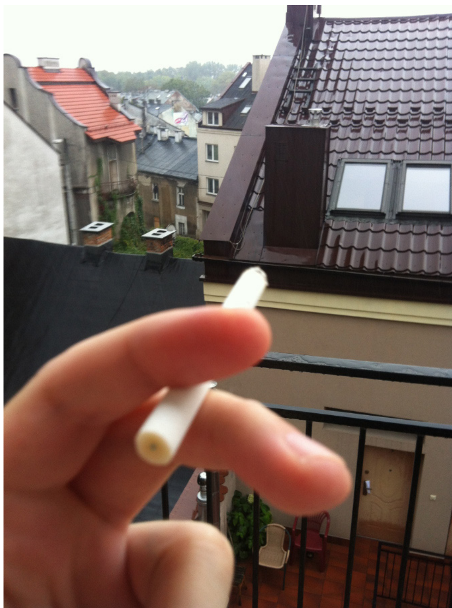
Fot. 1. Stan odrobienia.

mem, gdyż okazje mają to do siebie, że nie trzymają się planów.