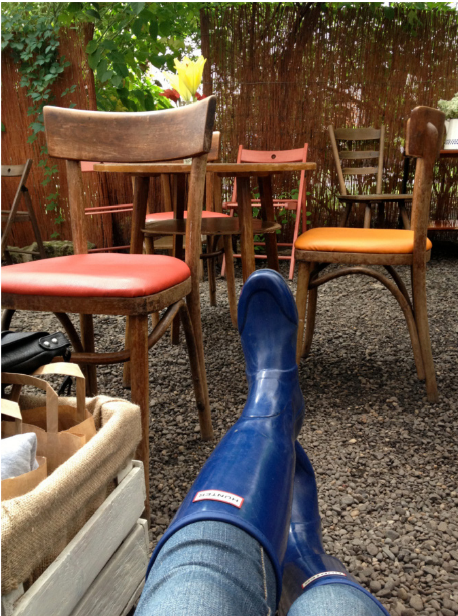
Fot. 2. Stan odrobienia.

Wiesz co, jak mogę sobie tak usiąść po prostu. [...] mimo tego, że mam siedzącą pracę i tam siedzę przy biurku, to chyba znów siedzenie mi się z tym kojarzy. Ale takie, gdy mogę wyciągnąć nogi przed siebie i założyć ręce za głowę. (niedoczas, K, 28)