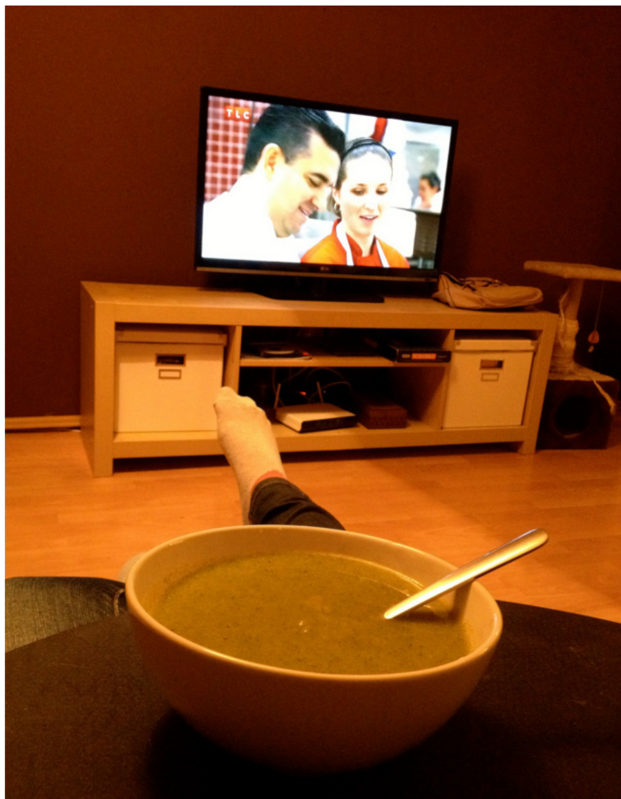
Fot. 3. Nudna odpoczynkowa powtarzalność.

Właściwie to mnie to trochę przeraziło, bo sobie uświadomiłam, że w sumie ten mój tak zwany czas wolny jest strasznie nudny i jest go strasznie mało. I że codziennie na zdjęciach jest to samo [...]. Tak nawet najpierw sobie myślałam, że ten tydzień, kiedy miałam robić zdjęcia, był mało reprezentatywny, ale to chyba jest wręcz przeciwnie, on bardzo dobrze pokazuje, jak bardzo mój czas wolny nie istnieje albo jest taki bylejaki... Aż mi głupio było po raz kolejny robić zdjęcia talerza [...]. (niedoczas, K, 25)